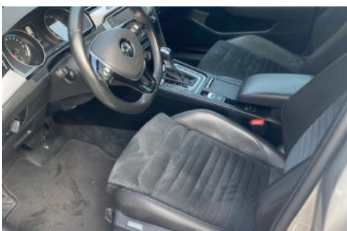
5 Interieur bestuurderstoel