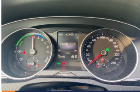
7 Km-stand (met contact aan)