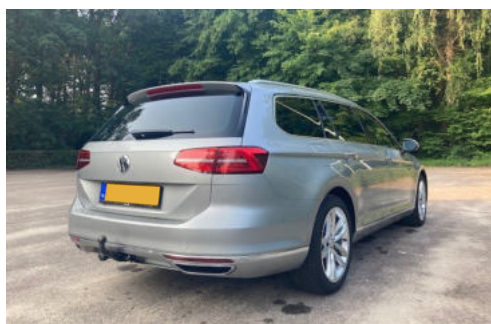
4 Exterieur rechtsachter