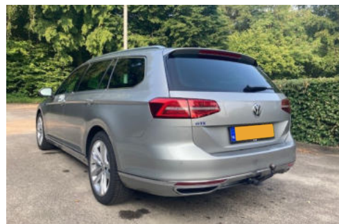
3 Exterieur linksachter