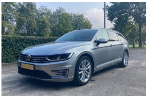
1 Exterieur linksvoor