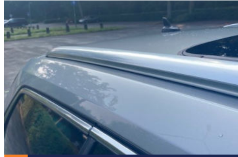
10 Eventuele schade