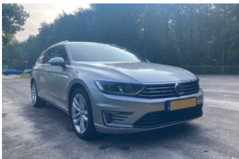
2 Exterieur rechtsvoor