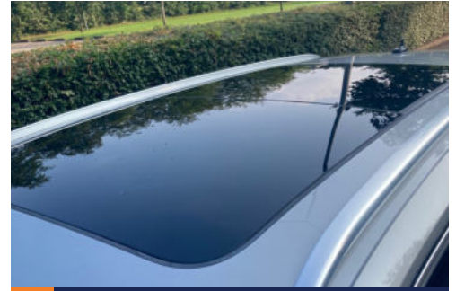
9 Extra opties