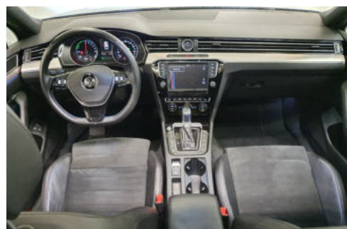
6 Dashboard (vanaf achterbank)